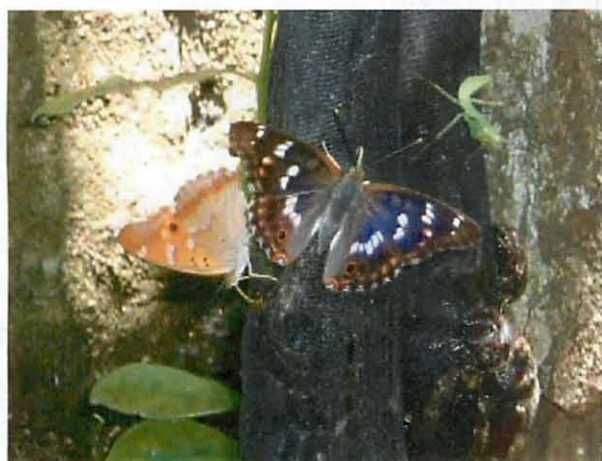
当館庭のバナナトラップに飛来したクロコムラサキ♂。

オオムラサキに比べると、街の中でも見かけることができ全国的に広く分布していますが、水上村のコムラサキは黒化型の「クロコムラサキ」が混ざるのが特徴です。クロコムラサキは全国的に見ても、ごく一部の限られた地域でしか見ることができないため、水上村に来て初めて見たときは感激しました。南九州には広く分布するとのことですが、村内のクロコムラサキ出現率は当方の感覚では 50%ほどです。村内では至る所で見ることができますが、こちらも個体数はそれほど多くはありません。コムラサキは、当館庭の柳でも発生しており冬に越冬幼虫も確認できます。