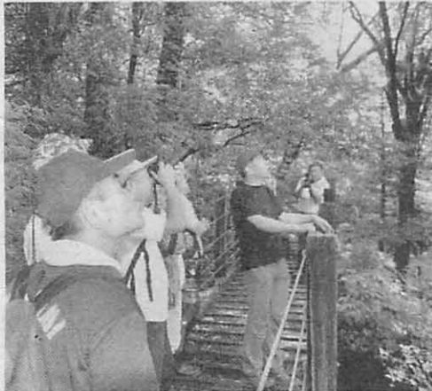
ゴイシツバメシジミを探す参加者

国内では2カ所で見ることができなくなった国指定天然記念物のチョウ「ゴイシツバメシジミ」の観察会が先月30日、生息場所の一つ、水上村の市房山麓で開かれたが、2年連続で確認できなかった。 保護活動を通して、自然の素晴らしさや重要性を発信する活動を