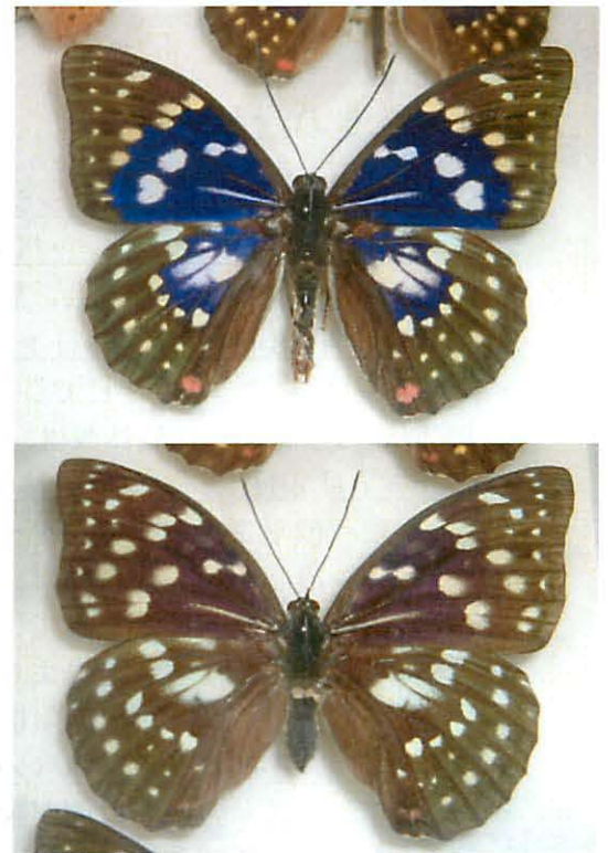
水上村産のオオムラサキ。 上が♂、下が♀