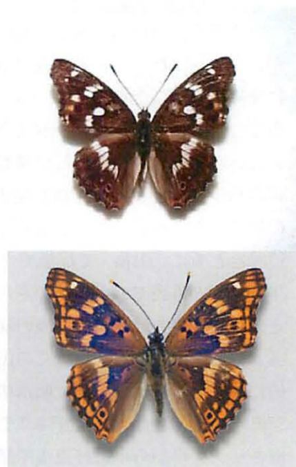
上がクロコムラサキ♂ 下が通常のコムラサキ♂

当方の思いつきの仮説では、もともとクロコムラサキは全国に分布していましたが、優性遺伝を持つ通常のコムラサキが日本の真ん中あたり？ から広がり、優性遺伝であるため全国的に通常のコムラサキが分布を広げ、まだ影響を受けていない端っこにクロコムラサキが残ったのではないかと勝手に想像しています。