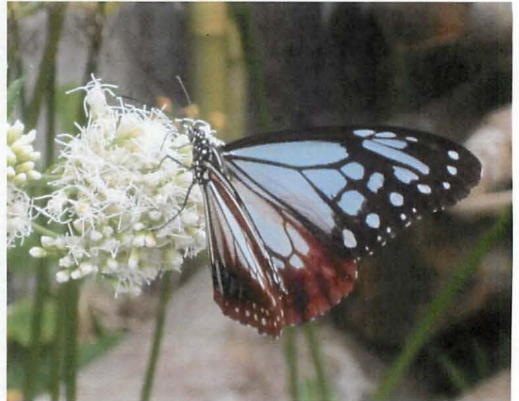
当館庭のフジバカマに飛来したアサギマダラ♂