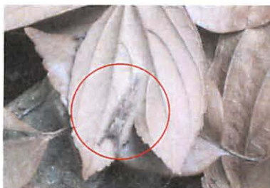
エノキの葉裏で越冬中のオオムラサキ幼虫。市房山登山口付近にて。

また、水上村ではほぼ全域に分布しているようですが、数は多くありません。当館（市房観光ホテル）庭にも、エノキが数本植えてありますので、冬になると落ち葉を調査していますが、今のところゴマダラチョウの幼虫ばかりでオオムラサキの幼虫を確認したことはありません。いつか、庭のエノキでも繁殖が確認されるのを楽しみにしています。